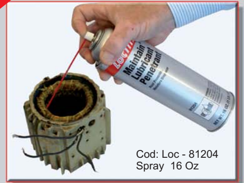
Cod: Loc - 81204 Spray 16 Oz