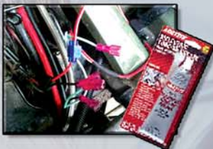
Cod: Loc - 375.35 Chisquete 2.7Oz

Necesaria para sistemas de encendido de alta energía. Usos sugeridos: Conexiones eléctricas en marina, automotrices, industria. Multiproducto de mantenimiento para equipos eléctricos.