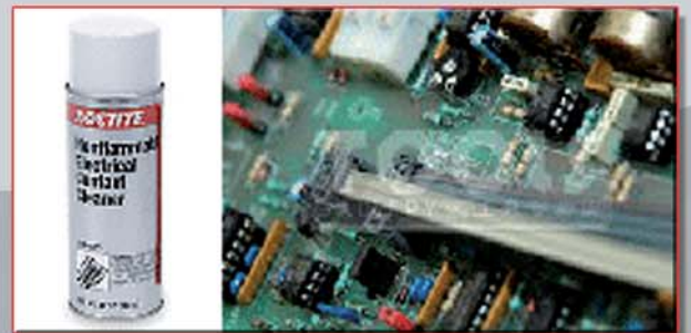
Cod: Loc - 1174633 Spray 15Oz

Remueve grasa, aceite y contaminantes de partes eléctricas para prevenir fallas de contacto. Evaporación rápida, seca en segundos sin dejar residuos. No conductivo, no corrosivo, no inflamable. No contiene CFCs o químicos Clase I que atacan la capa de Ozono (ODCs). Contiene HCFC-141b.