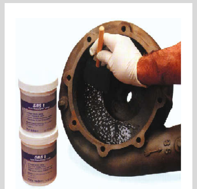
Brushable Ceramic 2 lb LOC-987.33

La soldadura es uno de los métodos tradicionales mas usados para la reconstrucción de dichas superficies dañadas, no solucionan este problema debido a que la soldadura al ser un metal seguirá generando esta capa de óxido que permite el desgaste de las piezas en los procesos de producción. Loctite desarrolla productos para la protección y y/o reconstrucción de las superficies desgastadas reemplazando esta capa de óxido por una capa con mayor grado de resistencia al desgaste superando hasta 5 veces a las aleaciones de cromo, debido a la abrasión, ataque químico y/o corrosión – erosión, alargando la vida útil de las piezas metálicas a un bajo costo. Elija el producto adecuado y lograra ahorros significativos en mantenimiento y el incremento de su productividad.